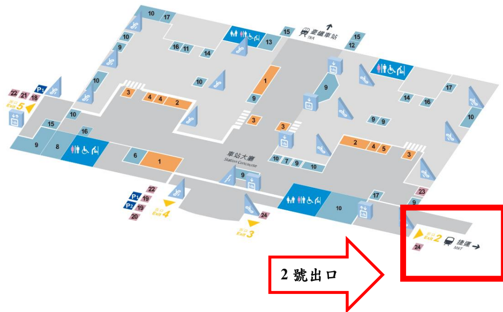
圖三、高雄左營高鐵站 1 樓平面圖