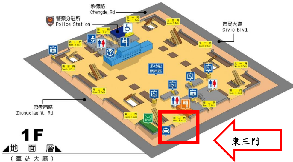
圖一、臺北車站 1 樓平面圖